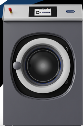
28 kg FX280

Lavadora montaje rígido, 28 Kgs, xcontrol plus todol ss 3d valve