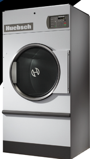
75 Lbs HT075RE

Secadora micro Galaxy reversible, 75 Lbs