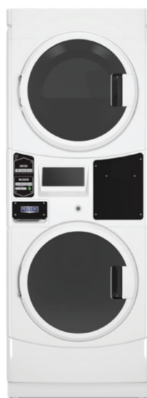
10 kg MLG22PR