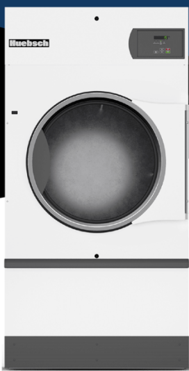
55 Lbs HT055 COIN

Secadora basic electronic, 55 Lbs, control gas 240/60/1