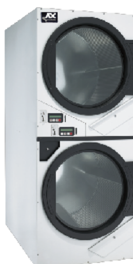
20 kg ADG45X2R