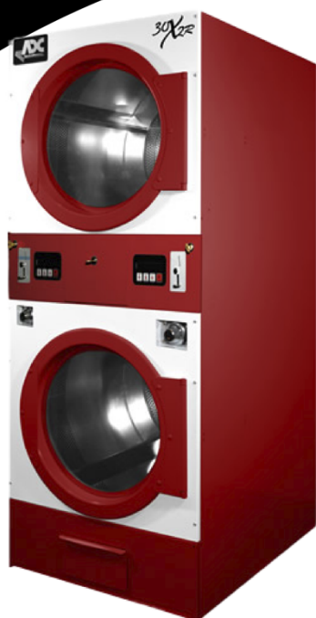
14 kg ADG30X2R