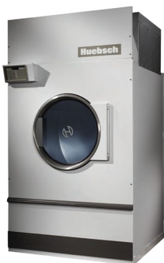
170 Lbs HT170RE

Secadora micro Galaxy reversible, 120 Lbs