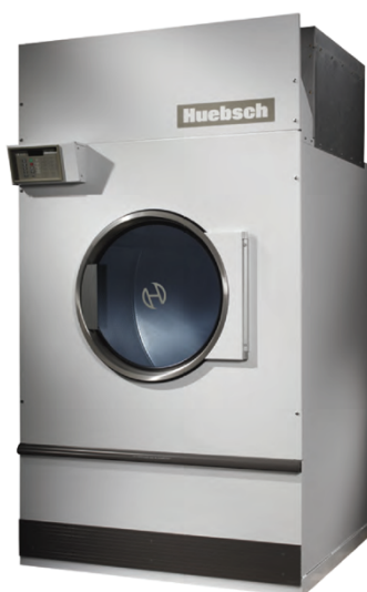
200 Lbs HT200RE

Secadora micro Galaxy reversible, 170 Lbs