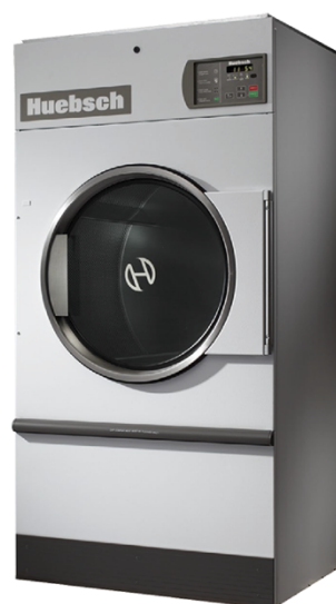
75 Lbs HT0E75QT

Secadora digital timer electronica, 75 Lbs