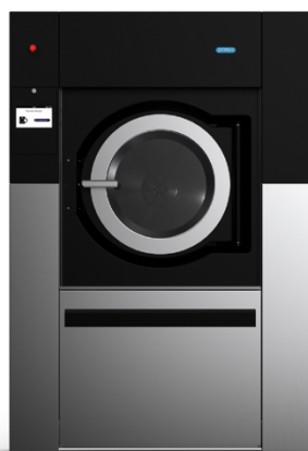
67 kg FX600

Lavadora montaje rígido, 28 Kgs, xcontrol plus todol ss 3d valve