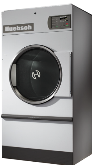
75 Lbs HT075QT