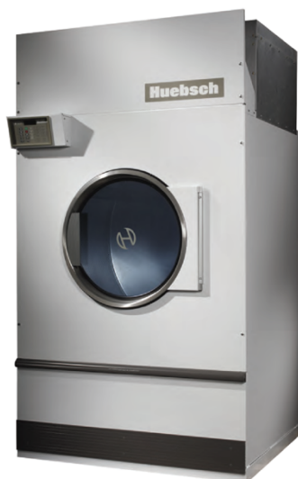
120 Lbs HT120RE

Secadora micro Galaxy reversible, 75 Lbs