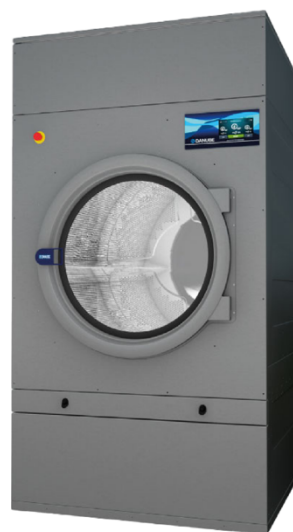
60 kg DD60GOLD

Lavadora montaje rígido, 80 Kgs, easy touch tactil 7", 29 programas 200g