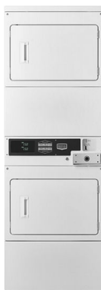
10 kg MLE22PD

Centro de lavado de 10 Kgs, Monedas, Gas