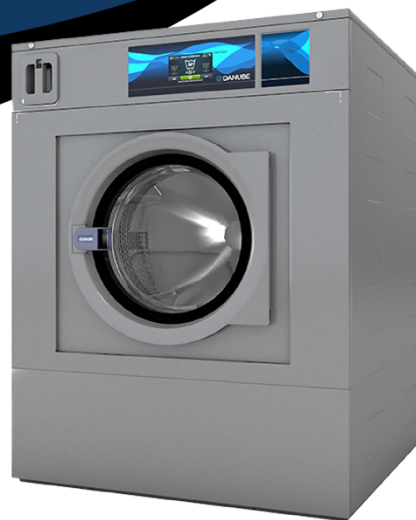
60 kg WEN60HW

Lavadora montaje rígido, 27 Kgs, easy touch tactil 7", 29