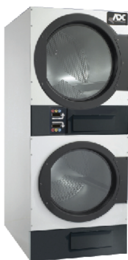
20 kg ADG-444D