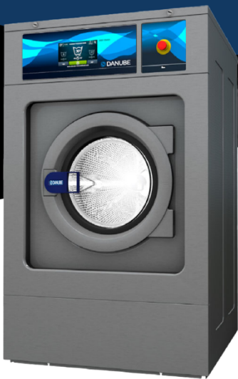
27 kg WEN27HW

Lavadora montaje rígido, 27 Kgs, easy touch tactil 7", 29