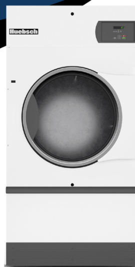
55 Lbs HT055QT

Secadora basic electronic, 55 Lbs, control gas 240/60/1