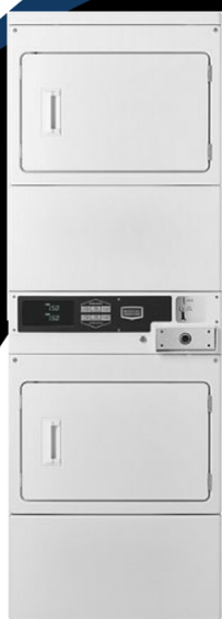
10 kg MLG22PD

Centro de lavado de 10 Kgs, Monedas, Gas