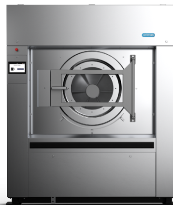
128 kg FS1200

Lavadora montaje rígido, 108 Kgs, xcontrol plus todol ss 3d valve